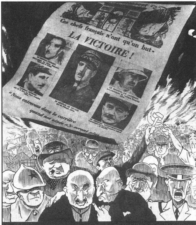
Un tract de Vichy.