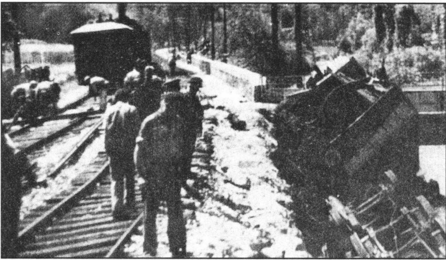
Sabotage d'une voie de chemin de fer, près d'Ambérieu-en-Bugey.