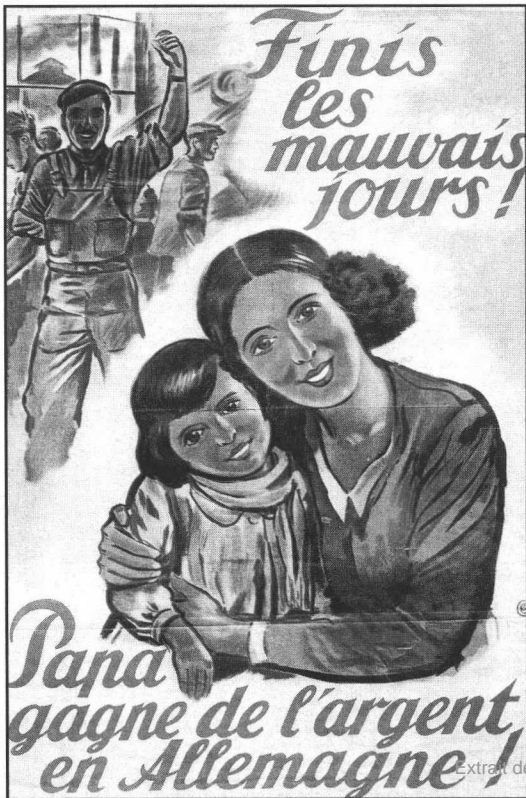
Affiches de propagande pour le travail volontaire en Allemagne, en attendant le STO, véritable point de départ des maquis.